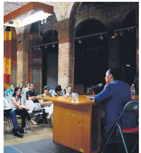
La posada en comú de la Taula es va fer ahir a Cal Massó de Reus

Precisament, aquests són els àmbits que coincideixen en la millora del valor afegit i són una combinació que no és fortuïta, sinó que es retroalimenten. Quant al capítol mediambiental, la situació és estructuralment negativa. Ens els darrers anys s'ha avançat i la comarca ja no encapçala els pitjors resultats, però el consum domèstic d'aigua i la recollida selectiva són assignatures pendents. ■