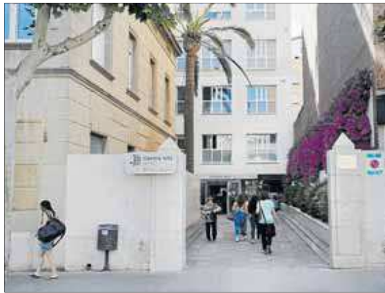
Imagen del Centre MQ Reus, instalado desde hace 18 años en la Clínica Fàbregas, en la calle Gaudí.

Lo que sí tienen previsto los dueños de las instalaciones de la calle Gaudí esta semana es intensificar los contactos y reuniones con los diferentes operadores sanitarios privados que se han interesado en los últimos días en instalarse en la antigua Fàbrega-