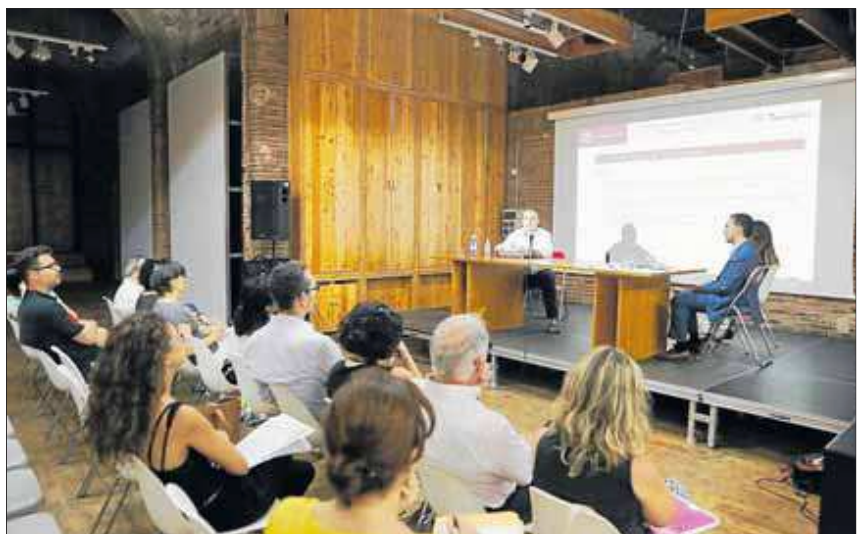
La Taula de Pobresa Energètica de Reus i Tarragona es va reunir ahir al Centre d'Art Cal Massó.

L'octubre de l'any passat, els dos ajuntaments, amb la col·laboració del Col·legi d'Enginyers Tècnics Industrials de Tarragona (Cetit) van realitzar 50 pre-auditories energètiques bàsiques a persones amb vulnerabilitat econòmica. Des de llavors s'ha treballat conjuntament per mi-