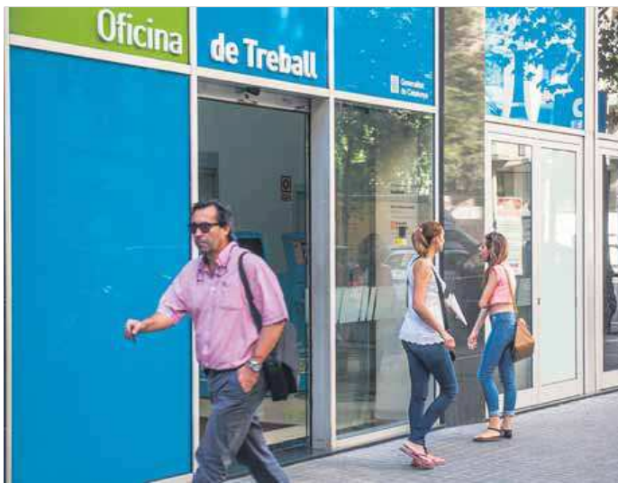
Entrada d'una oficina de Treball al carrer Sepúlveda de Barcelona

L'Alt Penedès es va consolidar durant el 2015 a la catorzena posició del rànquing i el Baix Penedès continua millorant, i l'any passat va arribar a la setzena posició, segons el document elaborat per la consultora Activa Prospect. La reestructuració del sector financer a l'Alt Penedès ha tingut un impacte molt negatiu a la comarca perquè el sector incidia de forma clara en la diversificació de l'economia comarcal. La important destrucció d'ocupació que l'Alt Penedès ha patit els últims tres anys ha acabat deteriorant la imatge de sostenibilitat del model econòmic que acompanyava la comarca. Entre els punts febles de la competitivitat destaquen la qualificació dels recursos humans i la provisió de