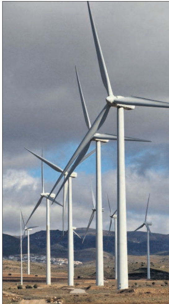
Generadores eólicos en Charches, Granada.

España, según el pronóstico de la Comisión, no estará en el paquete de incumplidores en 2020 y llegará al 20% al que está obligado. ¿Cómo es posible? Porque, para analizar el grado de cumplimiento,