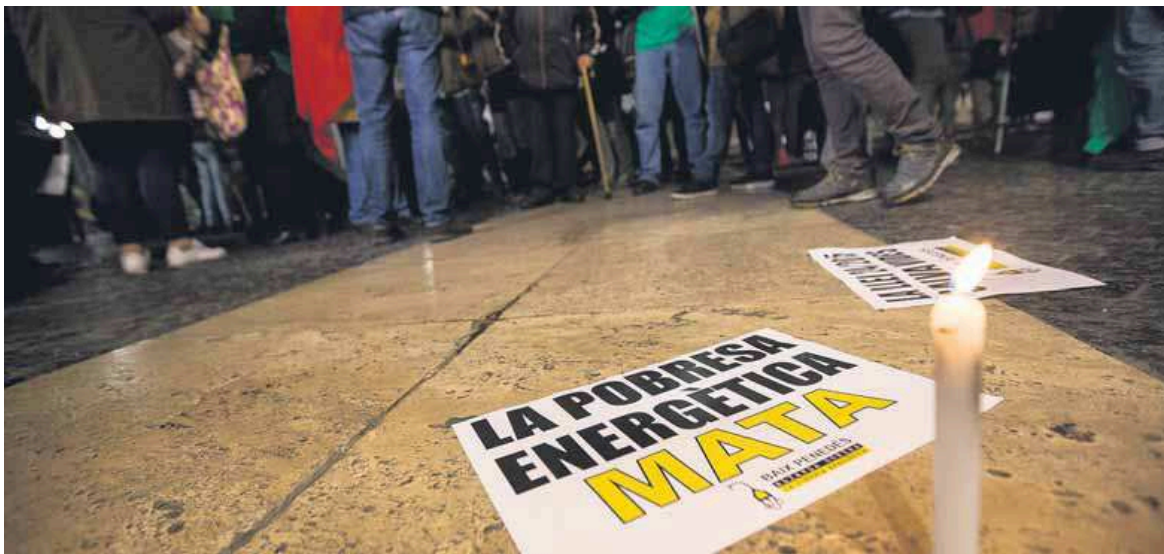
Una de les protestes reclamant mesures contra la pobresa energètica celebrades el novembre de l'any passat a Barcelona

Destina 4,5 milions a un pla contra la pobresa energètica a tot l'Estat ■ Amplia la devolució del deute de 6 a 24 mesos, activa un telèfon per als abonats amb problemes i reforça la comunicació amb serveis socials