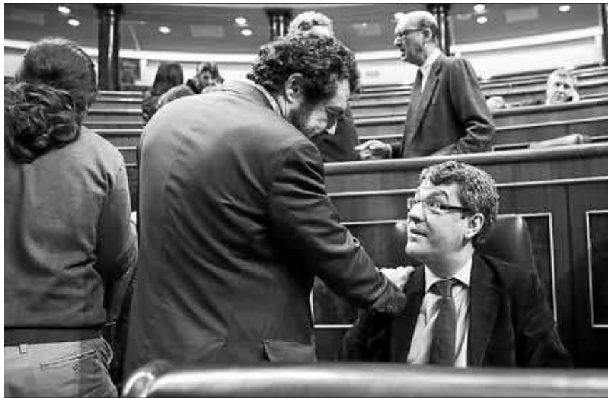
El ministro de Energía, Alvaro Nadal, ayer durante el pleno del Congreso de los Diputados.

Ese periodo de cuatro meses constituye una de las novedades más importantes que incorporará el desarrollo reglamentario del decreto ley que ayer fue aprobado en el Congreso. Hasta ahora, ese plazo se restringía a dos meses, el tiempo en el que las compañías no podían cortar el suministro en casos de impago mientras se realizaba la comprobación oficial. El ministro de Energía, Alvaro Nadal, anunció esta novedad durante el debate parlamentario que culminó con la validación de la norma negociada después de que en noviembre falleciera una anciana en Reus por el uso de velas. Al mismo tiempo, aclaró cuál será el procedimiento de actuación a seguir en el caso de los consumidores extremadamente vulnerables. Una vez que se produzca el impago, la compañía tiene la obligación de comunicárselo al usuario –«se tra-