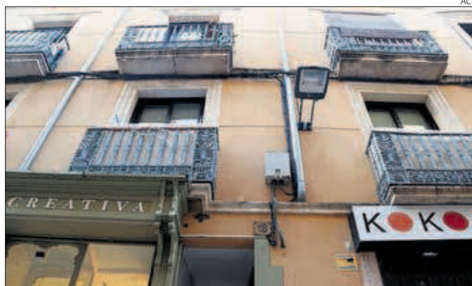
Imatge de la façana del número 18 del carrer Santa Anna, on va tenir lloc l'incendi.

rà mesures proactives de col·laboració amb els serveis socials municipals i les entitats del Tercer Sector, i en un pla més executiu, per exemple, s'amplia el termini d'avis per impagament de 2 a 5 mesos. Si en aquest