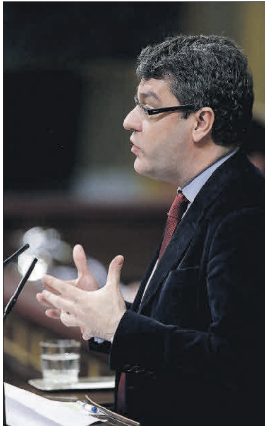
Á N gí g Dg . EFE

El ministro aclaró que la próxima regulación eléctrica propuesta por la Comisión Europea en el llamado Paquete de invierno exige mantener la señal de los precios energéticos, pero que ello no impide "a nuestro entender" establecer rebajas, y apuntaló esa interpretación al anunciar que la norma ya se había sometido a la autoridad de Bruselas, que no ha puesto "ninguna salvedad".