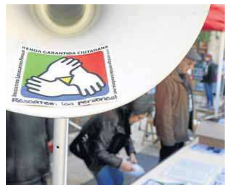
Dejuni per reivindicar la renda garantida que van fer diferents entitats a mitjan desembre a la plaça de Sant Jaume ■ O. DURAN

Pel que fa al calendari, el govern situa el desplegament de la renda garantida entre el 2017 i el 2020 i la comissió vol que ja sigui efectiva del tot el 2019. La prestació en el moment de plena aplicació quedaria en 664 euros una persona; 996, dues; 1.096, tres; i 1.196, quatre. ■