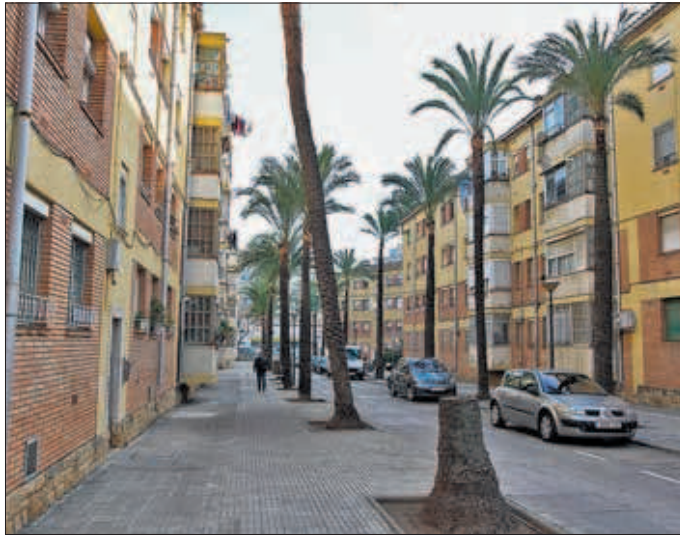
Diversos blocs de pisos situats al barri Fortury.

Segons assenyalen des del CO-AATE, del volum de les inspeccions realitzades tant a Reus com en altres punts de la demarcació, entre els problemes més freqüents hi ha «desperfectes en