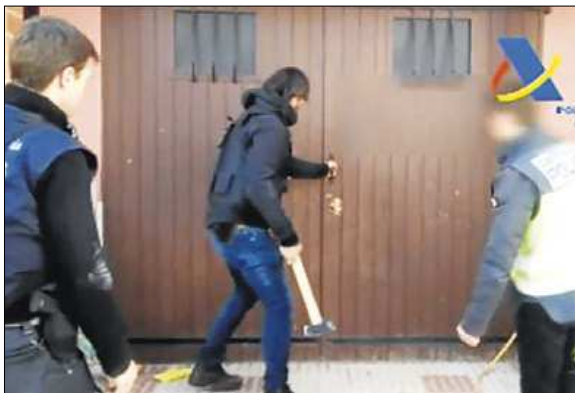
►► Entrada de la policia en un dels domicilis investigats i, a la dreta, una de les deu plantacions de marihuana intervingudes.