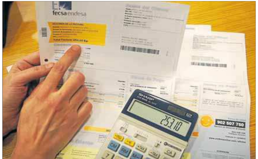
El punto de asesoramiento enseña a los consumidores a reducir el gasto energético.

Durante la visita, el profesional del Col·legi d'Enginyers, una vez estudiada la situación de los suministros de la persona que hace la consulta -en función de la situación- facilitará las recomendaciones que considere oportunas para la mejora de la eficiencia energética y la disminución