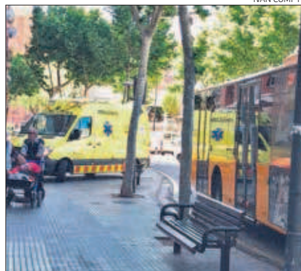
Una imatge de l'autobús implicat i les ambulàncies del SEM.

Ensurt ahir a la plaça Antoni Villarroel de Reus. Un autobús de la flota de la companyia municipal Reus Transport va atropellar un vianant que passejava per aquesta plaça poc abans de les onze del matí. La dona va resultar ferida i va ser traslladada en estat menys greu a l'Hospital Joan XXIII. A causa de la brusca frenada del vehicle hi va haver també una segona persona ferida en els fets. Es tracta d'una passatgera del mateix autobús, que també va ser traslladada fins a l'Hospital Joan XXIII, ferida lleu. Fins al lloc de l'atropellament s'hi han desplaçat dues ambulàncies del Servei d'Emergències Mèdiques (SEM).