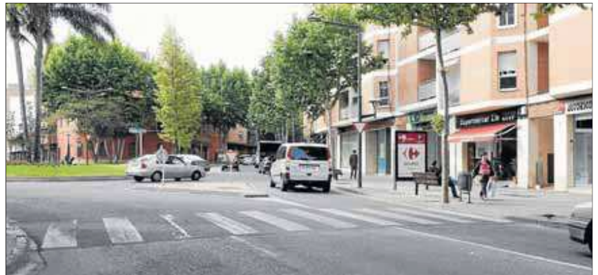
El accidente tuvo lugar en este paso de peatones de la calle Cambrils.

Ambas víctimas, de carácter leve, fueron trasladadas en ambulancia hasta el Hospital Universitari Sant Joan de Reus, donde después de ser visitadas fueron dadas de alta.