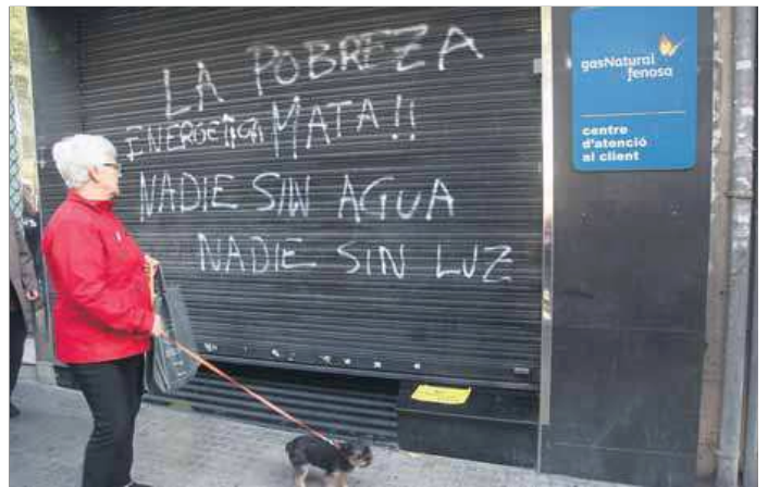
Una dona passa per davant de la seu de Gas Natural, a Reus, el novembre passat

Pel que fa als requisits per poder aspirar a la subvenció, Vilella va explicar que els sol·licitants han d'haver estat empadronats els dos darrers anys a l'habitatge pel qual demanen les ajudes. En aquesta línia, va detallar que la unitat familiar no podrà superar el llindar de renda de 7.967,73 euros en el cas