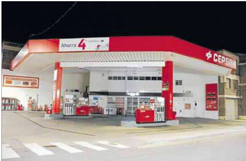
Imagen de la gasolinera de Lleida donde tuvo lugar el atraco que precedió al tiroteo.

El atraco de la gasolinera se habría gestado en Reus ya que, además de que los dos presuntos