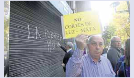
Una de les protestes que es van fer a Reus

Lliuren més de 160.000 signatures per evitar el sacrifici de l'animal