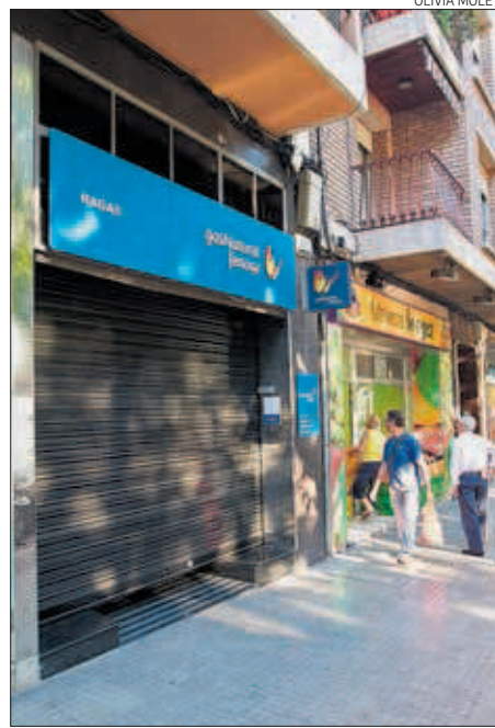
Oficina de Gas Natural Fenosa, al Passeig de Sunyer.