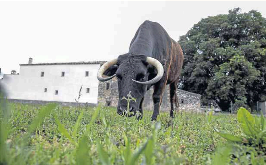
Imatge de la vaca Margarita, l'animal que està en situació il·legal pel fet de no estar registrada ■ LUCIA ALBANO

OBRES · La nova directora preveu que la reforma del museu arqueològic acabarà el 2020