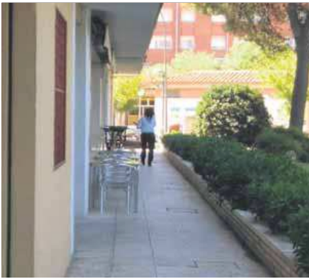
Pas de vianants intern del bloc 3 de Torrenova, al barri de Torreforta, ocupat amb taules i cadires del bar ■ J.C.