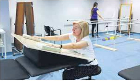
Les instal·lacions són al sociosanitari Francolí ■ ACN