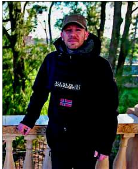
Maoz al CIMIR, on va oferir una xerrada de fotografia comercial.

—N'hi ha que et donen llibertat, et diuen què volen i que confien en tu; en són molt pocs així. Molts et dicten exactament què has de fer, amb quin equip comptaràs... També cal dir que no estem a Barcelona o Madrid, i que el sector de la fotografia comercial està limitat, així que la meua principal feina no és la fotografia, és promocionar el meu negoci i trobar clients. Sempre dic que treballa un 70% d'emprenedor i un 30% de fotògraf. M'agradaria que fos més però és impossible perquè hi ha molta competència, i també em sento molt afortunat d'aixecar-me