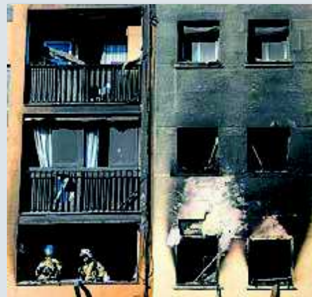
Efectius dels bombers en un balcó del bloc que es va cremar al barri de Sant Roc de Badalona. CÈLIA ATSET

"En una altra zona de Catalunya no hauriem tingut l'ajuda dels bombers de Barcelona", recorda Del Río, que alerta que això fa que fora de l'àrea metropolitana s'agregui la pre-