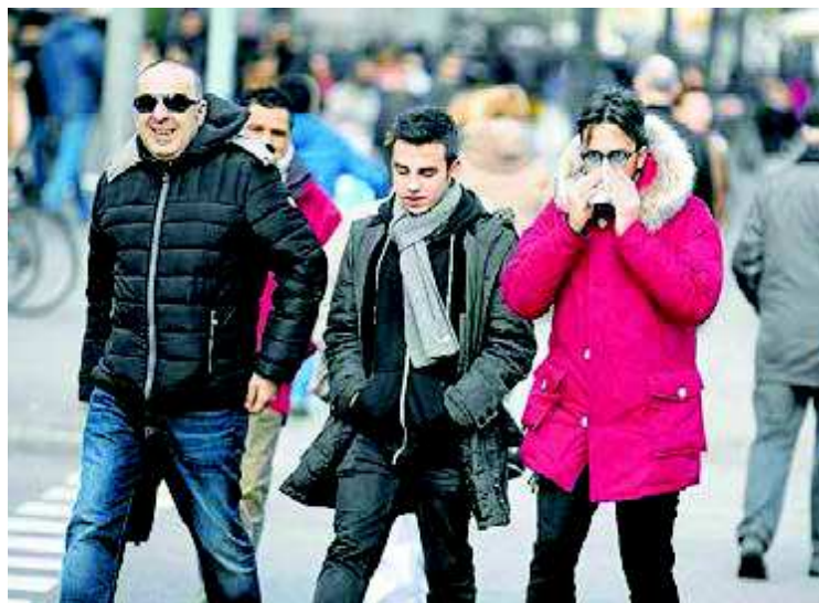
El fred que arriba a Catalunya aquesta nit obligarà a abrigar-se encara més. PERE TORREDERA

Aquesta setmana el Centre Europeu de Predicció ha fet pública la temperatura mitjana global d'aquest 2018. No hi ha hagut rècord, però aquest any ha estat el quart més càlid des que se'n recullen dades, i els tres que queden per sobre del 2018 són justament els tres anteriors. És a dir, qualsevol dels últims quatre anys ha estat més càlid al món que cap altre des de mitjans del segle XIX. Segons el projecte europeu Copernicus, l'any 2018 la concentració de gasos d'efecte hivernacle va continuar augmentant, i ho va fer amb un ritme creixent respecte al 2017. —