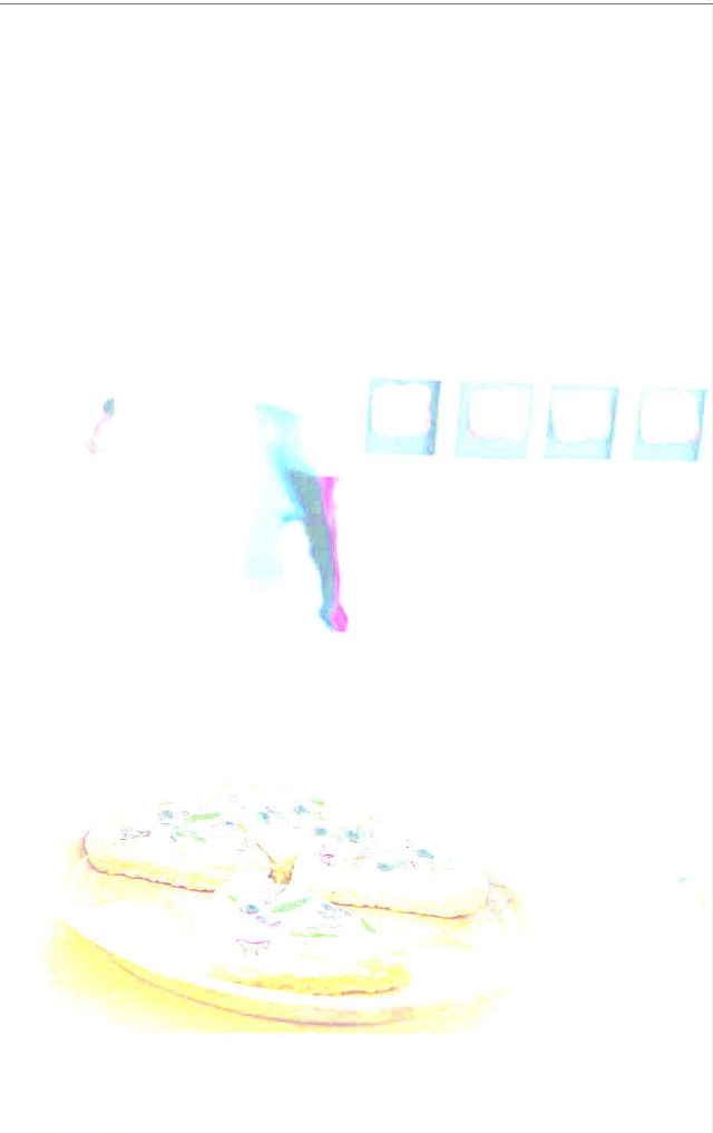
Aula de l'institut escola Trinitat Nova, divendres passat.

al pròxim pla. Perquè l'encara vigent va ser motiu d'una agra controvèrsia entre els socis quan ja no ho eren, quan l'alcaldeessa ja havia fet fora els socialistes pel seu suport a l'aplicació del 155 a Catalun-