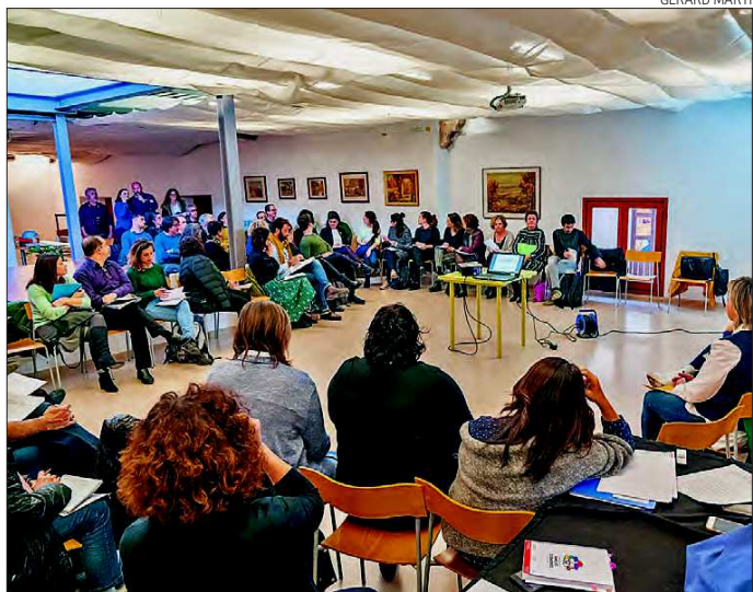
Instant de la reunió d'ahir en què hi van assistir representants de Cambrils, Salou i Vila-seca.

subministradores d'energia i aigua. L'anterior reunió es va fer l'any passat al Mas Iglesias de Reus. Aguilar va celebrar «l'ampliació amb aquestes noves incorporacions de més agents i persones implicades en l'abordament d'aquesta problemàtica social de primer ordre al nostre territori». «Considerem que és un espai de treball necessari perquè és una problemàtica amb una dimensió fonamental de la pobresa com ho és l'energètica i transcendeix fronteres municipals i, per tant, és molt bona tota la coordinació que puguem fer» va valorar Aguilar. La consellera va celebrar l'assistència d'algunes empreses energètiques però va lamentar, també, que van «trobar a faltar la participació d'algunes altres». Segons Aguilar, les conclu-