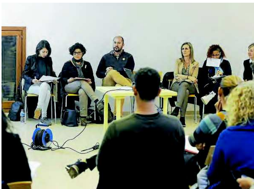
A la reunión de la mesa acudieron una cuarentena de personas, incluidos representantes de otros municipios.

Aguilar-Cunill señaló que la pobreza energética sigue siendo «un problema social de primer orden»,